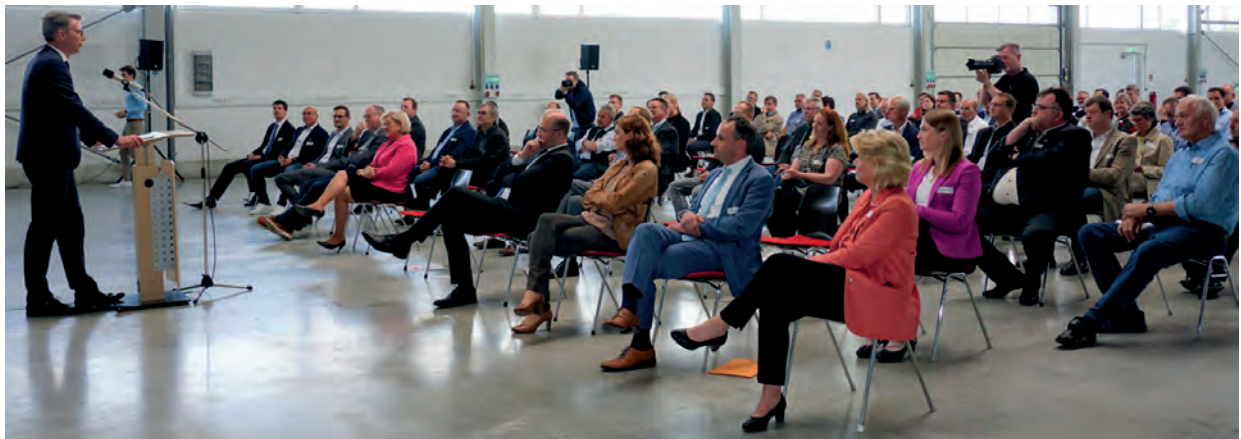
Die Voraussetzungen sind erfüllt, die Arbeit kann beginnen. (Foto 2: Blick in die Gästerunde)